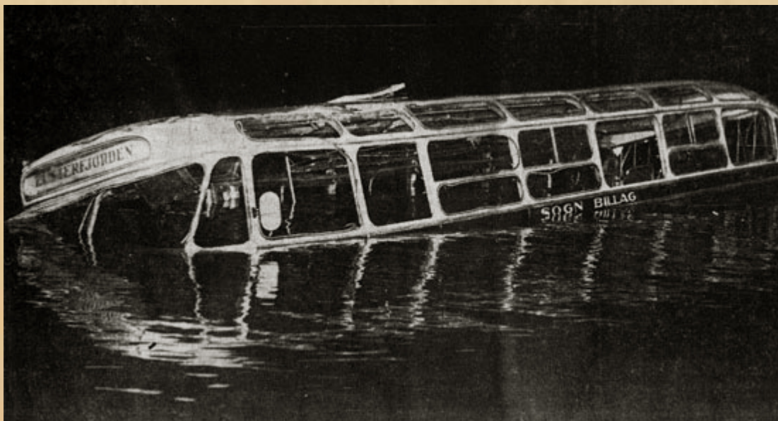
Ulykkesbilen i Lusterfjorden i morges.