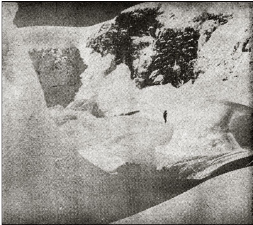
Medi fjølse Brimkjelen — Denne botnen vert fylt opp med vatn, og kan avstadvoma flaum i Leirdøla. (Bredemma innfjø).